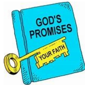
Unlock every good thing